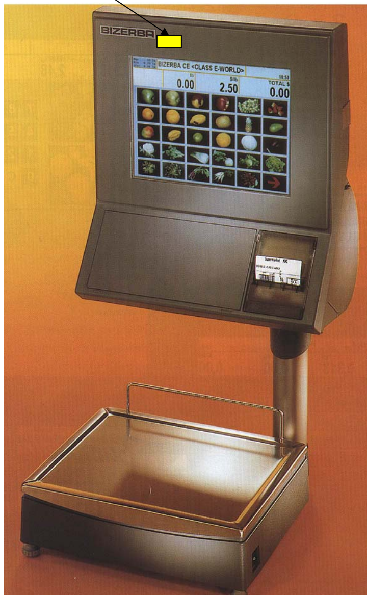
CE 500 S